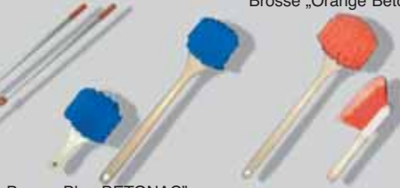
Brosse Bleu BETONAC®