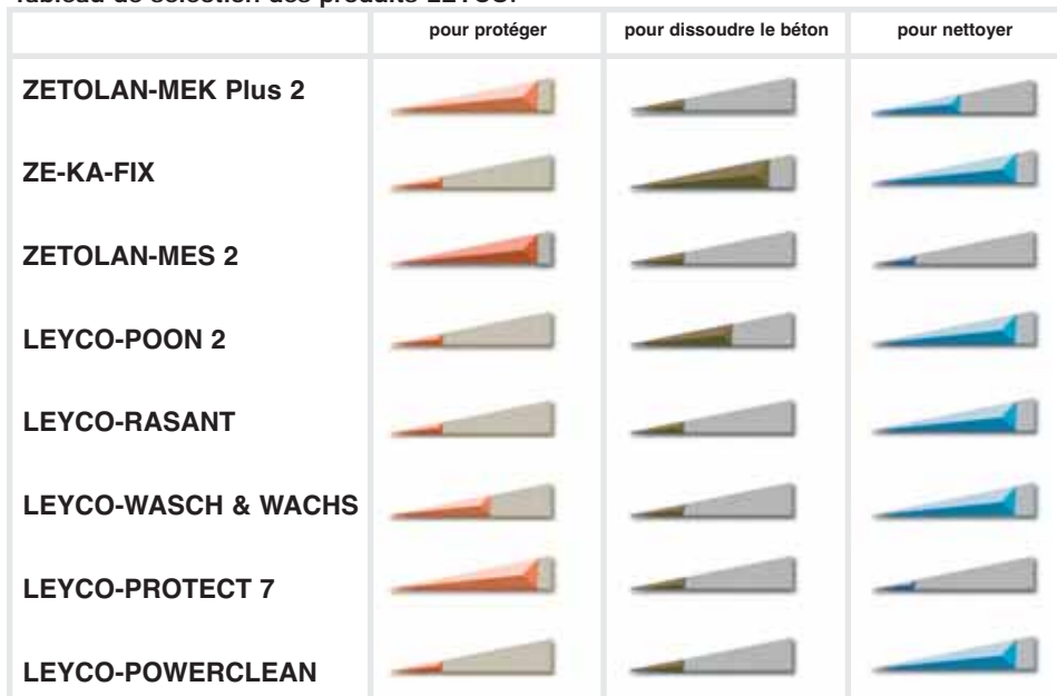
Tableau de sélection des produits LEYCO: