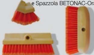
Spazzola Bi-Level Orange BETONAC e Spazzola BETONAC-Orange