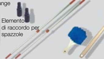
Elemento di raccordo per spazzole