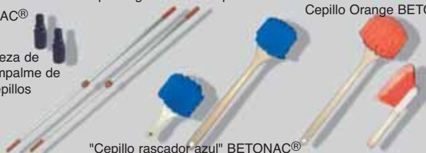
Cepillo Orange BETONAC®