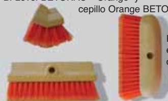
Bi-Level-BETONAC®-Orange y cepillo Orange BETONAC®